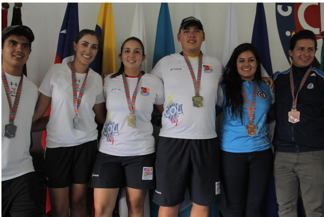
Equipo Mixto Compuesto – México, Colombia, Guatemala

Compuesto Masculino: México, República Dominicana y El Salvador. Compuesto Femenino: México, Colombia y Guatemala. Compuesto Mixto: Colombia, México y Guatemala.