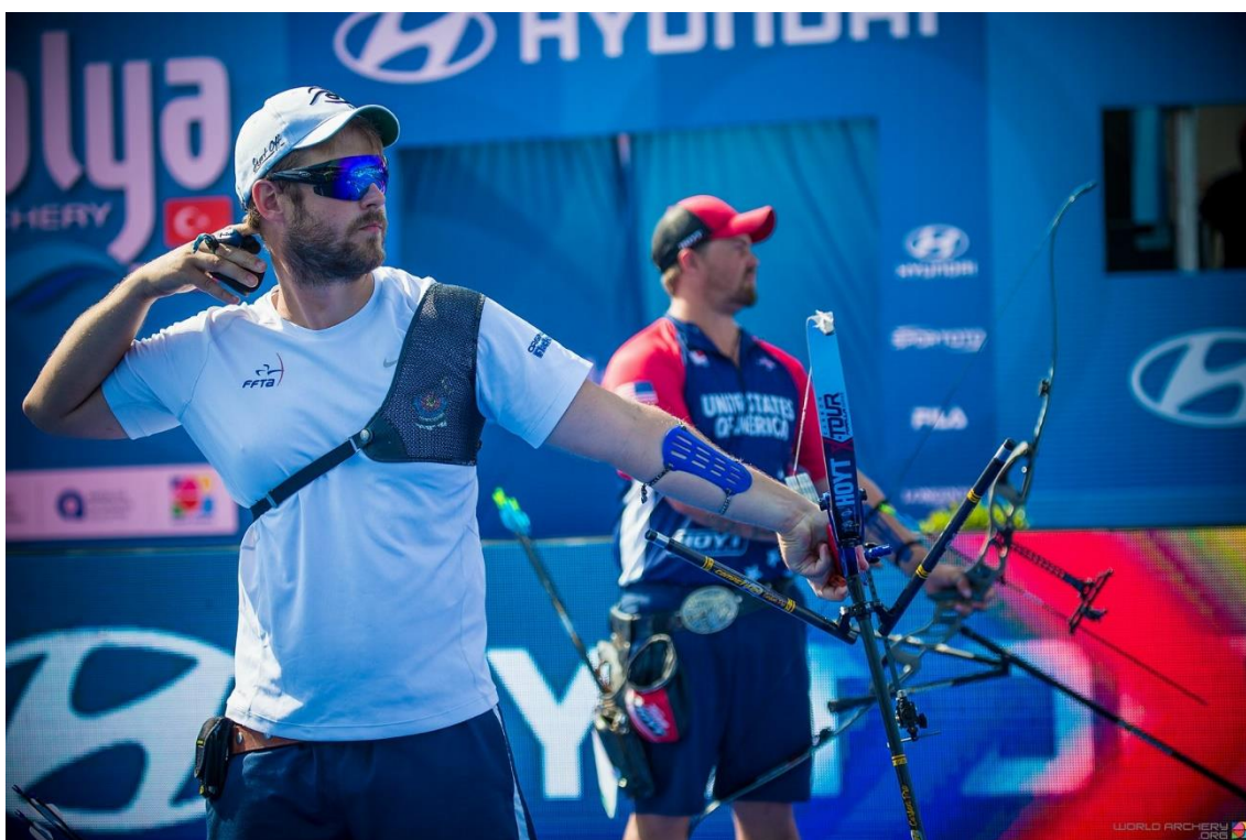
VALLADONT vs ELLISON

A la Final de Recurvo Masculino llegaron los medallistas olímpicos de Río Jean-Charles VALLADONT (FRA) y Brady ELLISON (USA). El norteamericano había ganado la Ronda de Clasificación con 686 puntos, nueve más que el francés. En la Final, sin embargo, VALLADONT disparó tres sets de 29 puntos y venció a Brady 6-2. David PASQUALUCCI, un italiano que también compitió en Río, ganó el bronce.