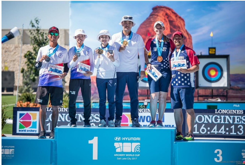
Recurve Mixed Teams: TPE, KOR, USA

Korea won the remaining team titles: Recurve Mixed, Compound Men, and Compound Women. Outstanding third positions for the US Compound Women and Recurve Mixed squads. A pleasant comeback of the Compound Men's team of El Salvador: fourth place in Salt Lake City.