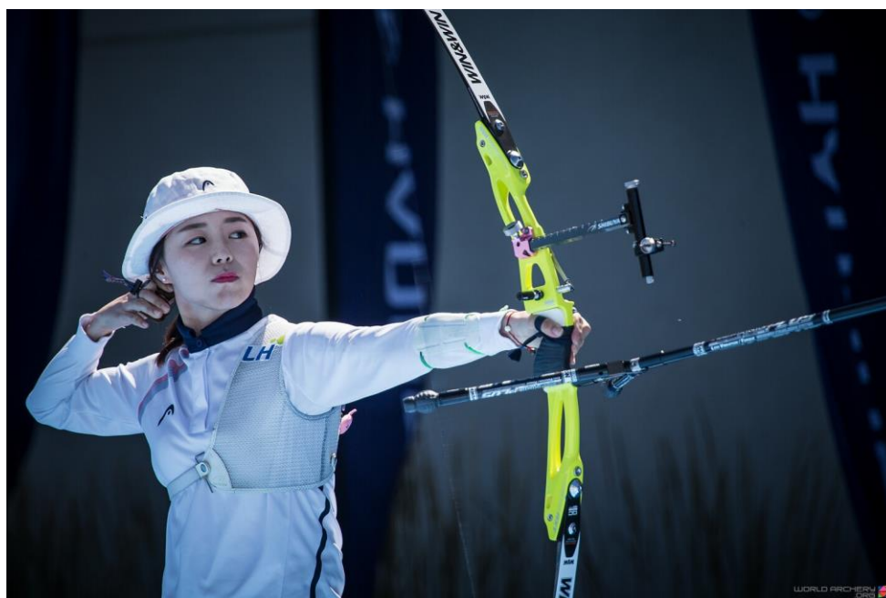
CHANG Hye Jin (KOR)

La Campeona Olímpica de Río CHANG Hye Jin iba camino a establecer un nuevo record Mundial para la Ronda de Clasificación, pero el viento comenzó a soplar más fuerte dos series antes del completamiento de la Ronda, y sus 683 se quedaron tres puntos por debajo de la actual primacía universal de 686 en poder de la campeona mundial KI Bo Bae.