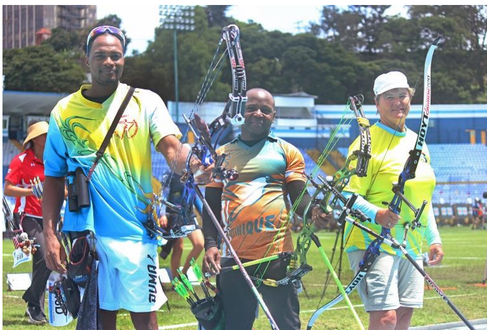
Monder, Clombe y Abernathy

Tres de nuestros países ganaron puestos para estos Juegos por primera vez. Este es el caso de las Islas Vírgenes USA, y de los Miembros Asociados recientemente afiliados: Martinica y Guadalupe. Las Islas Vírgenes estuvieron representadas en Veracruz 2014, pero ocupando un espacio que quedó vacante luego de que un Comité Olímpico Nacional renunciara a una plaza que habían ganado sus arqueros.