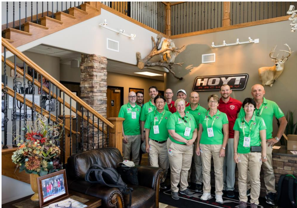
The judges who officiated in SLC, visiting the Hoyt factory during a break from duty