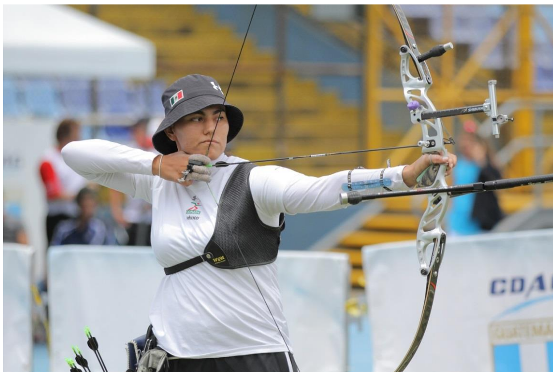
Alejandra VALENCIA (MEX)